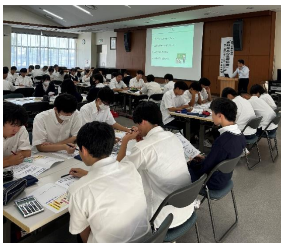
足利銀行の講師先生による全体説明