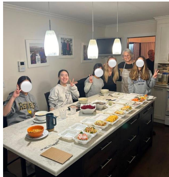
ホストファミリーとお客様と…

私はマグロのお寿司を頼んだのですが、生の魚を食べることをすごく驚かれました！！誕生日ケーキはホームメイドと、ホストマザーが1つずつ買って来て、みんなで2つのケーキを食べました。