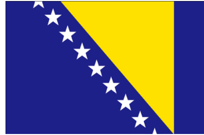
ボスニア・ヘルツェゴビナの国旗

また、今回のホームステイにはホームメイトもいます。ホームメイトは中国出身です。家族みんなすごく優しく、楽しく過ごしています！あまり一緒に出掛けることはないのですが、ご飯の時にみんなで話しています。休みの日にはホストマザーと日本からのお土産の組子と一緒に作りました。