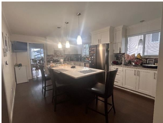
いつも食事をするダイニングキッチン